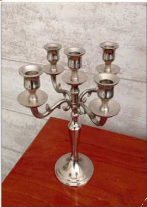
Chandelier argenté Hauteur 27 cm 5 euros