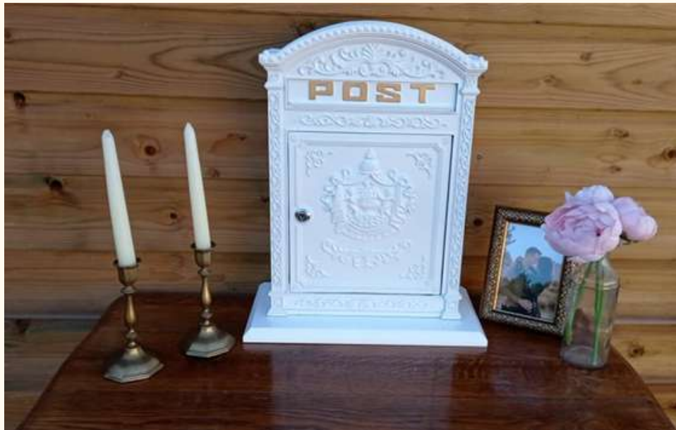
Boîte aux lettres avec clef 20 euros