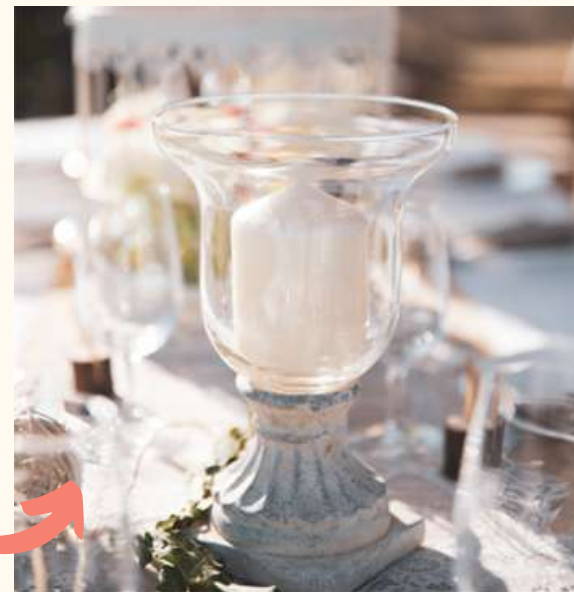
Bougeoirs verre sur pied Hauteur 22 cm / Qté 2 5 euros pièce