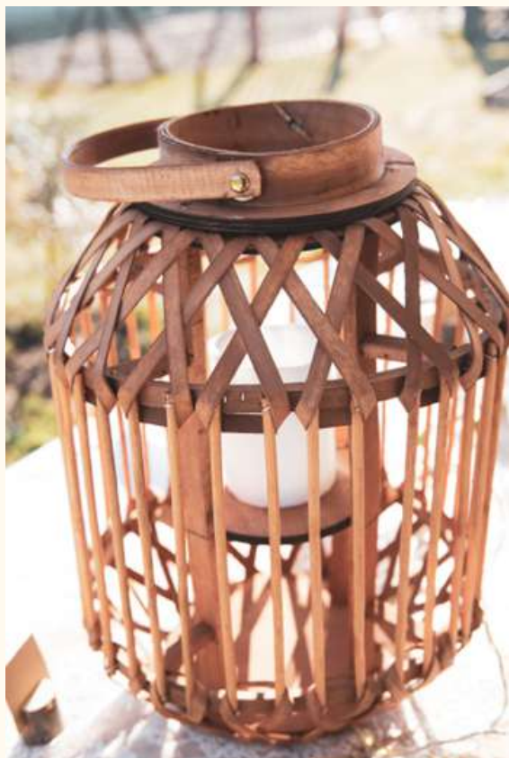
Lanterne aspect bois Hauteur 40 cm / Qté 2 10 euros pièce

Oh la bonne idée!!! Pour une soirée à la belle étoile, pour orner une allée centrale... Les lanternes naturelles apportent charme et élégance en toute circonstance!