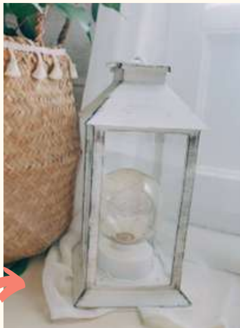
Lanternes effet bois Hauteur 19 cm / Qté : 8 8 euros pièce