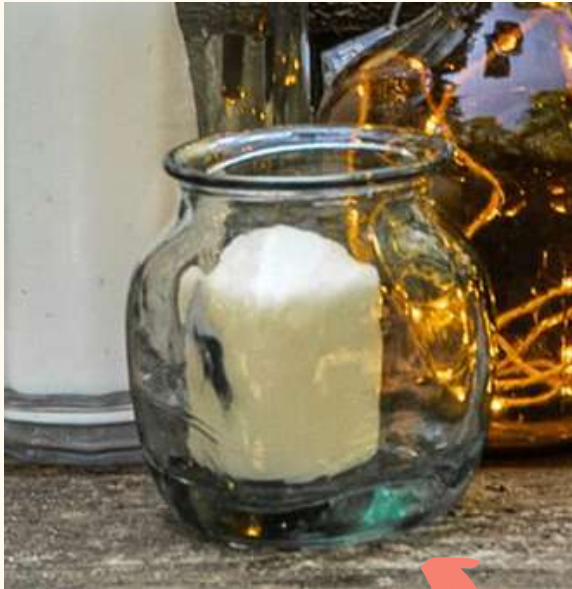
Pot en verre Lot de 3 5 euros