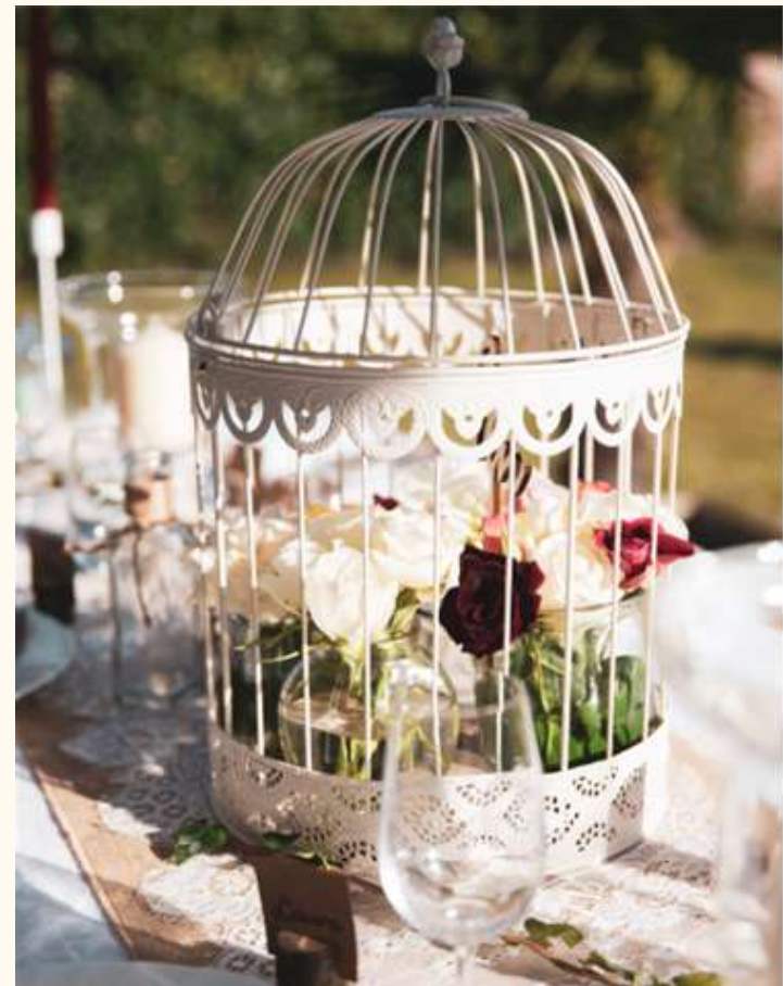
Cage à oiseaux 2 tailles disponibles 10-15 euros