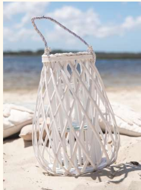
Lanterne en rotin blanche Hauteur 40 cm / Qté 4 10 euros pièce

Oh la bonne idée!!! Pour une soirée à la belle étoile, pour orner une allée centrale... Les lanternes naturelles apportent charme et élégance en toute circonstance!