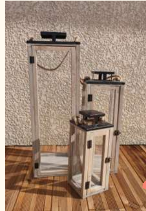
Lanternes avec porte, bois clair Hauteur: 70 cm/50 cm/40 cm Qté:2 20/15/10 euros pièce

Centre de table, jalonnant une allée centrale ou élément du photobooth... Faites vous plaisir!!