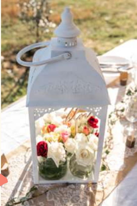
Lanterne blanche Hauteur 50 cm 15 euros