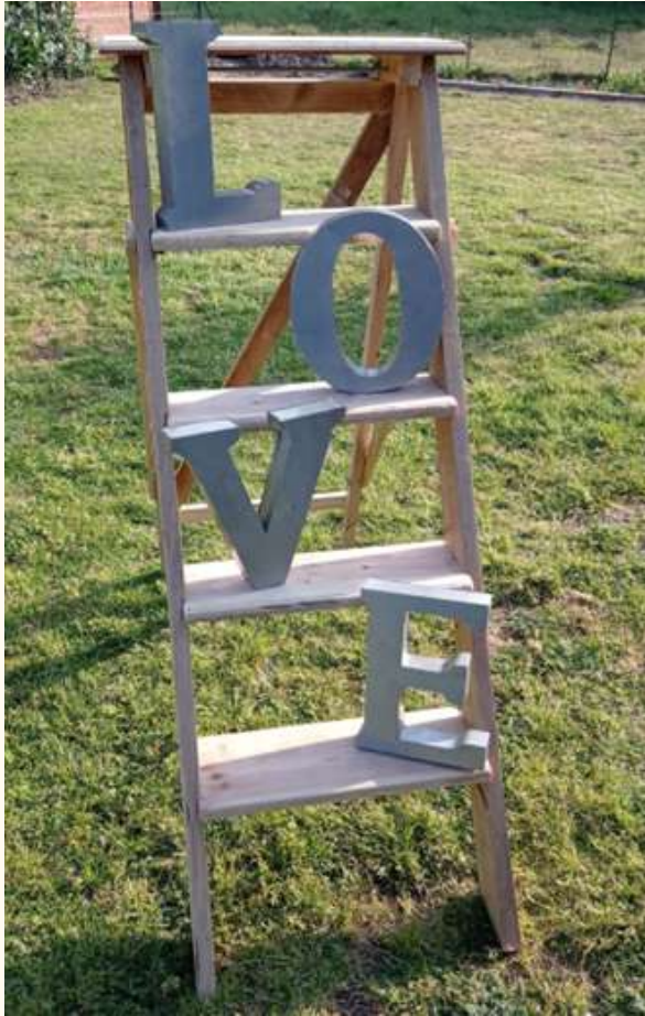
Escabeau 4 marches Loué sans décoration 15 euros

Plan de table, candy bar, support à souvenirs.. Sortez des codes!