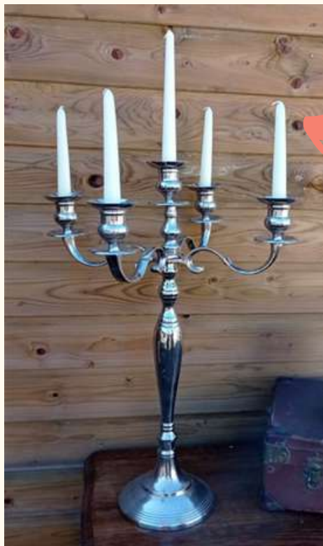
Chandelier argenté Hauteur 72 cm/ Qté: 2 12 euros