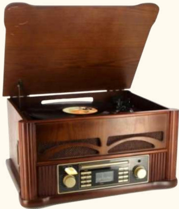
Radio / tourne disque vintage 15 euros

Ces objets sont à avoir pour une décoration vintage réussie! Destinés exclusivement à la décoration.