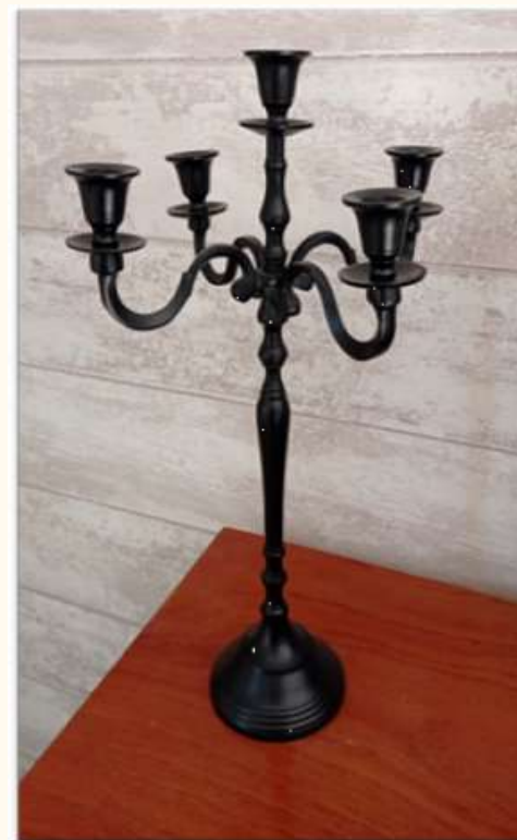
Chandelier noir Hauteur 51 cm 10 euros

Un indémodable de la décoration! Le chandelier apporte élégance et douceur! Créez l'exclusivité d'une table d'honneur!