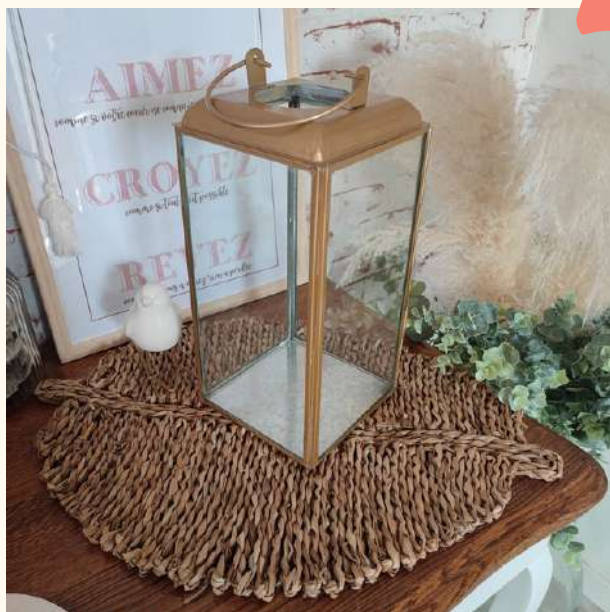
Lanternes métal doré Hauteur 19 cm / Qté : 4 8 euros pièce