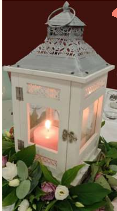
Lanternes avec porte, blanc et gris Qté:8 10 euros pièce