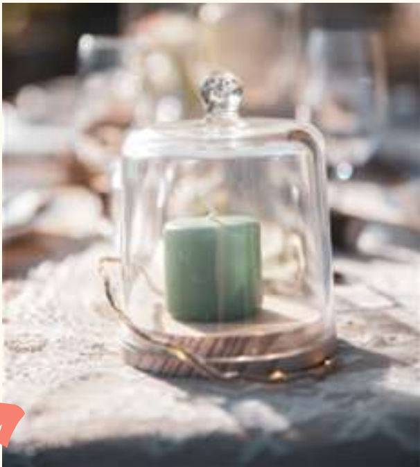
Cloches en verre /Lot de 4