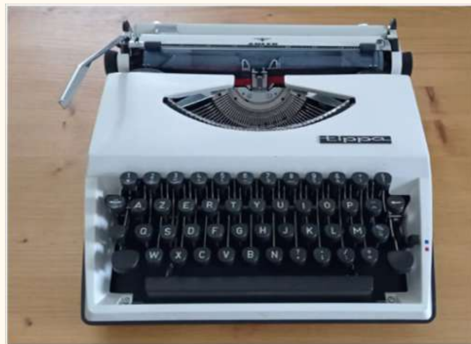
Machine à écrire 15 euros